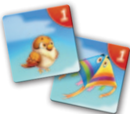
2 páry s 1 bodom