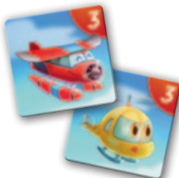
2 páry s 3 bodmi