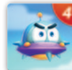
1 Paar mit 4 Bewegungspunkten