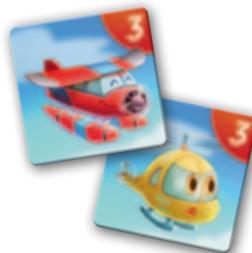
2 Paare mit 3 Bewegungspunkten