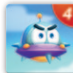
1 pár 4 lépésszámmal