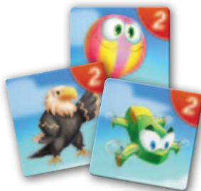
3 Paare mit 2 Bewegungspunkten