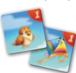
2 Paare mit 1 Bewegungspunkt